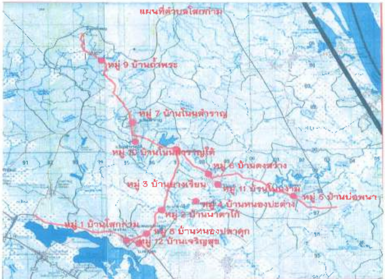
(ภาพที่ 1) แผนที่ตำบลโสกก่าม